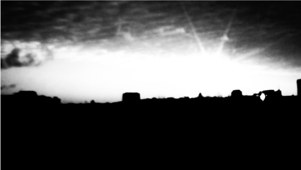
Under the Midnight Sun - MéliSSa Faivre (FR) - 2022 - 4'15"

Le travail de MéliSSa Faivre rejette la narration conventionnelle et remet en question notre façon de percevoir. «Under the Midnight Sun» («Sous le soleil de minuit») est une danse d'ombres et de lumière, de textures de niveaux de gris qui s'étendent à travers le paysage d'une ville apocalyptique. Le soleil est une lune qui se dévoile au moyen de dynamiques visuelles palpitantes, de fréquences instables et de rythmes vibrants; jusqu'à ce qu'il se désintègre en particules et pixels et disparaisse dans l'obscurité. Cette pièce visuelle et musicale à l'aura sombre et inquiétante évoque un monde d'après la catastrophe, où l'humain semble avoir disparu.