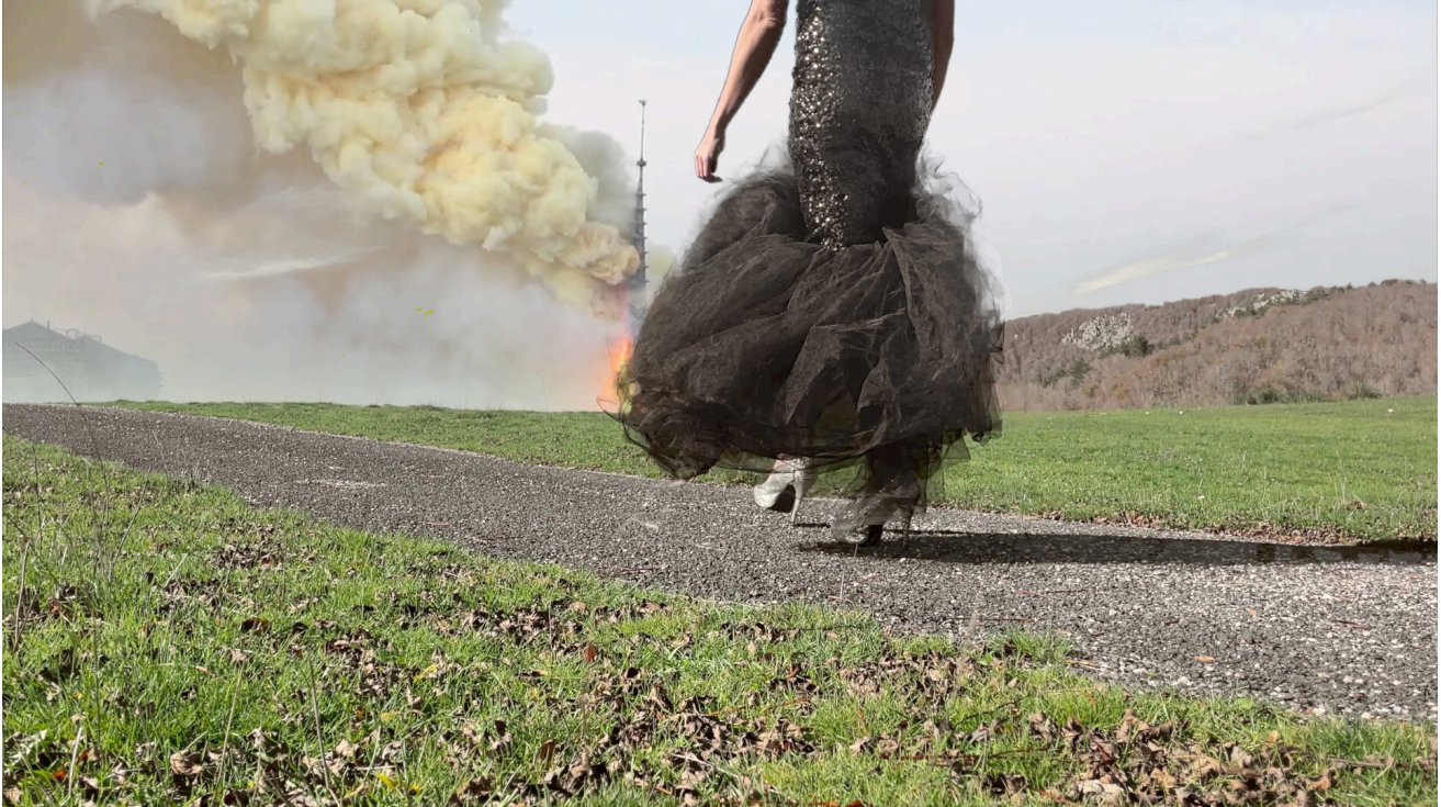
Technocratium - Florænt Audoye - 2023 © ADAGP, Paris

« Le travailleur du capitalisme pharmacopornographique n'est pas un animal, mais une machine vivante (travailleur·se numérique, soignant·e ou reproductrice, féminisé·e et radicalisé·e), dont le métabolisme organique a été modifié biotechnologiquement et dont les actions, la totalité de la vie, sont contrôlées numériquement. C'est le devenir cyborg de la travailleur·se contemporain·ne (animal·e ou humain·e). » - Paul B. Preciado, in DYSPHORIA MUNDI. Le son du monde qui s'écroule (2022)