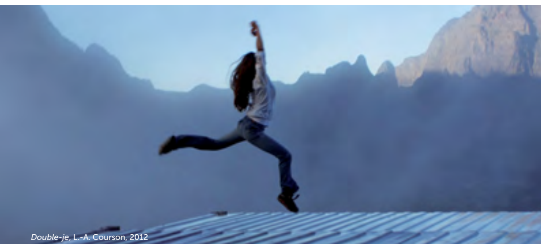
Double-je , L.-A. Courson, 2012