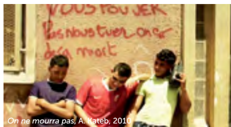
On ne mourra pas, A. Kateb, 2010