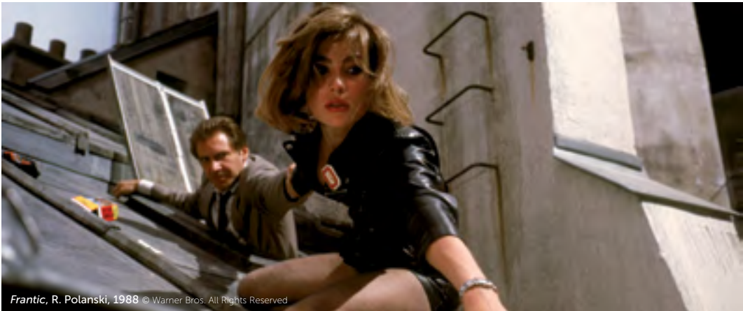
Frantic , R. Polanski, 1988