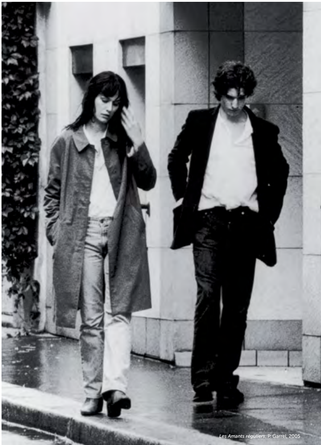
Les Amants réguliers, P. Garrel, 2005