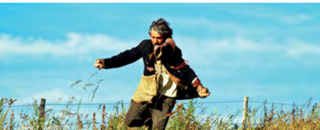
Liberté , T. Gattif, 2010