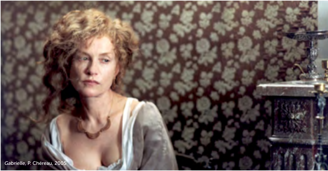
Gabrielle , P. Chéreau, 2005