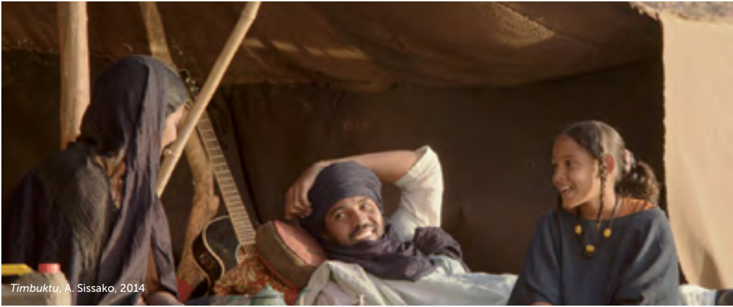
Timbuktu , A. Sissako, 2014