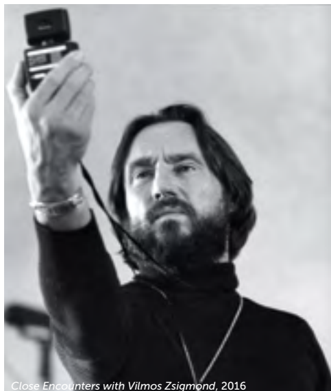
Close Encounters with Vilmos Zsigmond, 2016