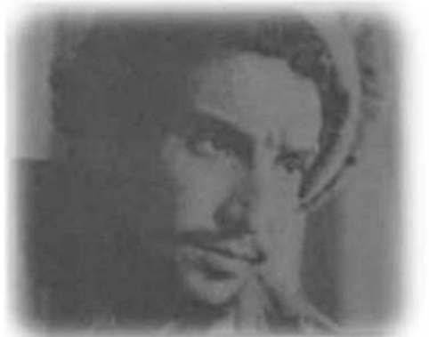
Ahmed Shah Massoud

Oui, mais ils produisaient des films en format 16 mm, d'autre part c'étaient des militants politiques ; enfin notre but à nous était de faire de la fiction.