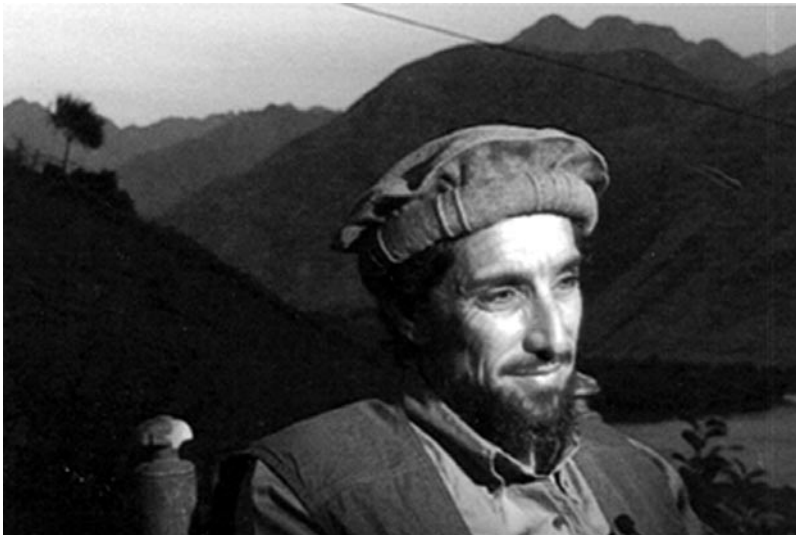
Ahmed Shah Massoud

En rejoignant le dernier bastion de la résistance du commandant Masoud, dans la vallée du Panjhir qui s'étend sur 100 kilomètres au nord-est de l'Afghanistan, Christophe de Ponfilly reprend pied en terrain connu : depuis 1981, à travers plusieurs reportages, il s'est lié d'amitié avec Massoud, le combattant légendaire de la guerre contre les Soviétiques. Affaibli, isolé, trahi par beaucoup de ses amis, celui que l'on surnomme le «lion du Panjhir» livre toutes ses forces dans la défense de sa vallée. En suivant les préparatifs d'une offensive contre les talibans, le réalisateur demande une nouvelle fois à Massoud de témoigner sur une histoire dont il est l'un des principaux acteurs. Entrecoupé de séquences extraites de ses précédents films, Massoud, l'Afghan rappelle quelques hauts faits du chef de guerre : comment celui-ci a réussi à fédérer plusieurs groupes de résistants, ou encore son rôle salvateur lors d'une des plus meurtrières offensives de l'armée soviétique en 1984.